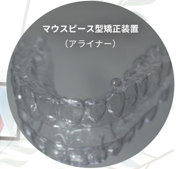
マウスピース型矯正装置 (アライナー)

同システムでは、アタッチメントの設置による自在な歯牙移動(牽引等)も可能 になり、さらに治癒期間の短縮も図れます。