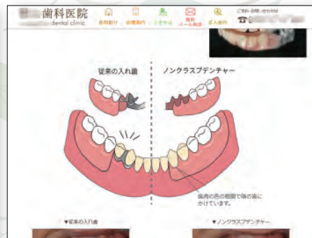
技工物の特徴、メリットの説明図