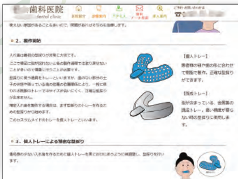
治療や器具の説明図