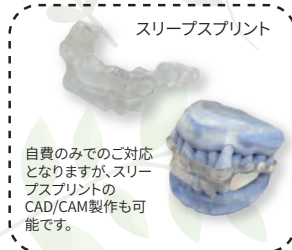
スリープスプリント

自費のみでの対応となりますが、スリープスプリントのCAD/CAM製作も可能です。