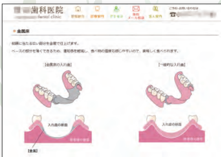
技工物の構造の説明図