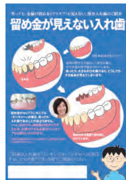
ハイブリッドデンチャー版